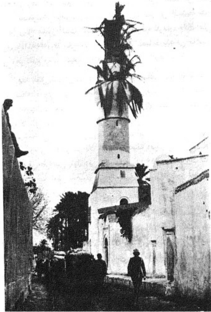
مسجد بطرابلس وقد اخفيت منارته بجريد النخيل من قبل الايطاليين لتبدو وكأنها قلعة المدفعية التركية.